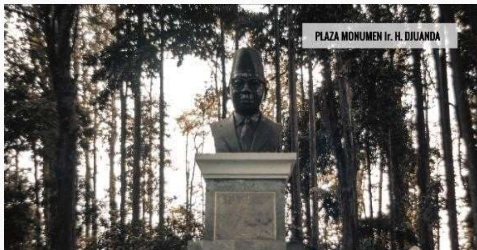
PLAZA MONUMEN Ir. H. DJUNDA